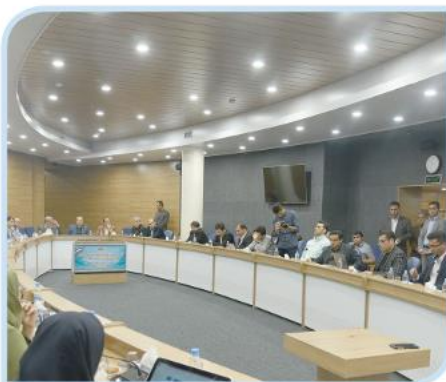
نشست جوانان ایده پرداز حوزه روستایی