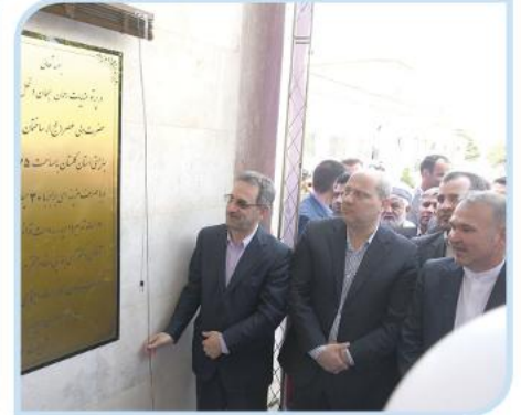
افتتاح ساختمان بهزیستی استان گلستان