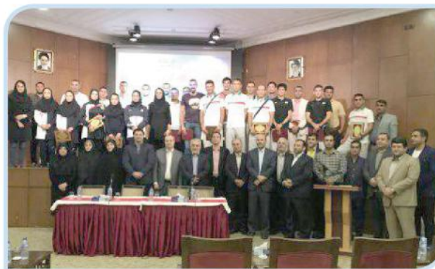
مراسم بدرقه ورزشکاران گلستانی به مسابقات آسیایی ۲۰۱۸ اندونزی