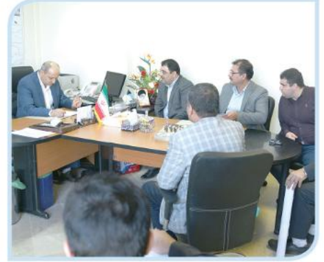
ملاقات مردمی استاندار گلستان