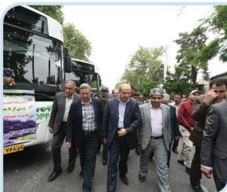
رونمایی از ۲۰ اتوبوس مدرن شهری در گرگان