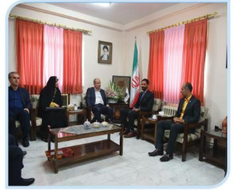
بازدید از رسانه های استان به مناسبت روز خبرنگار