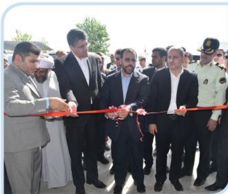
افتتاح شرکت تولیدی آرد ترکمن دشت