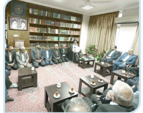
دیدار معاون پارلمانی رئیس جمهور با نماینده ولی فقیه در استان