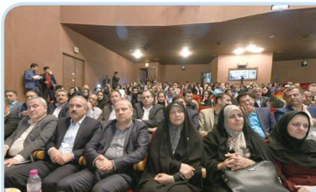
مراسم گرامیداشت ۱۷ مرداد، روز خبرنگار