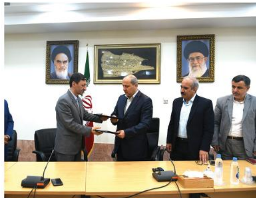
امضاء تفاهم نامه همکاری میان استانداری گلستان و کمیته امداد امام خمینی (ره) کشور: