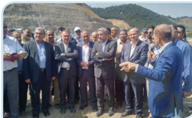
بازدید وزیر نیرو از سد نرماب