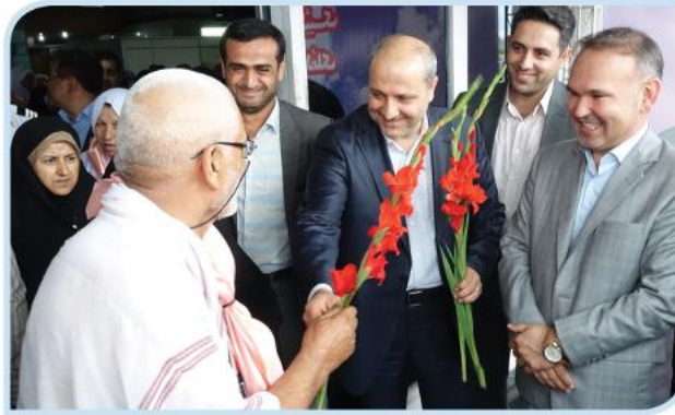
بدرقه حجاج گلستانی